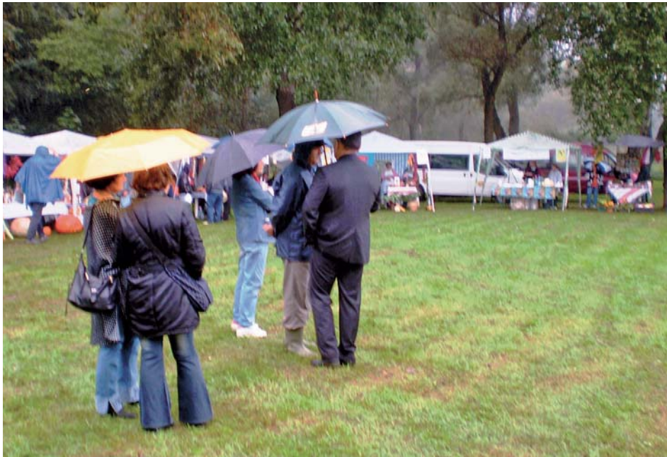
A Sorsfordító program kisszékelyi terménybörzéje, 2010. szeptember

Már több esetben utaltunk arra, hogy a Sorsfordító program egyik legnagyobb előnye nagymértékű rugalmassága. Ez minden szinten megjelenik: oktatás, pénzügyek, mentorálás és a szervezeti rendszer tekintetében is. Ennek a rendszernek a megvalósíthatósága nagyban